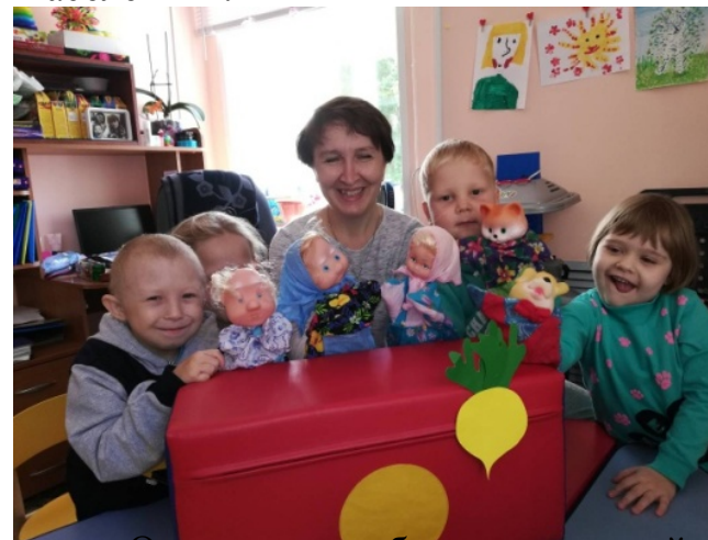
Отделение реабилитации детей с ограниченными возможностями.

Государственное бюджетное учреждение социального обслуживания Владимирской области «Селивановский комплексный центр социального обслуживания населения».